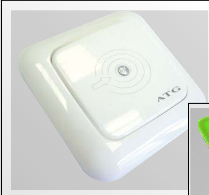
AT-ZTA 06 mit Busch Jäger Modul